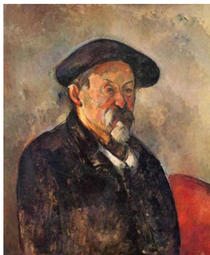
Autoportrait de Paul Cézanne

Ces différentes notions de formes et de couleurs sont prépondérantes dans le quotidien des enfants. Il y a entre ces deux univers, celui de l'artiste et celui des enfants, une vraie rencontre.